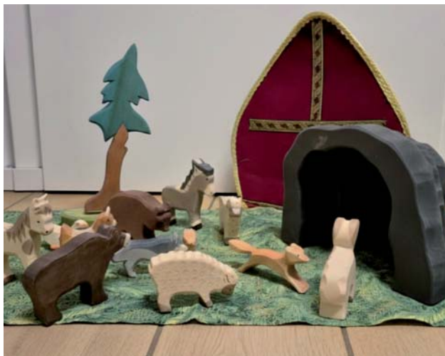
Ein Bodenbild zum Hl. Blasius entsteht

Etwa zur Gabenbereitung kehren wir erfüllt und mit Energie zurück, um die Kommunion und den Abschluss des Gottesdienstes gemeinsam mit allen als eine große Gemeinschaft zu verbringen.