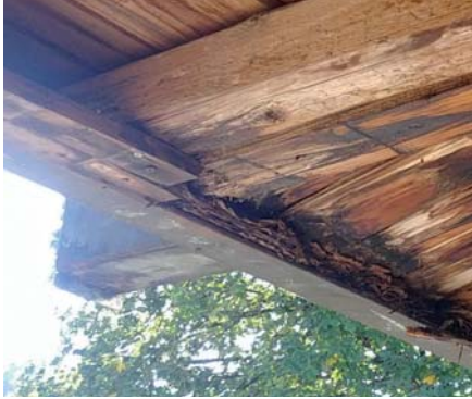
Typischer Wasserschaden vor und nach der Reparatur